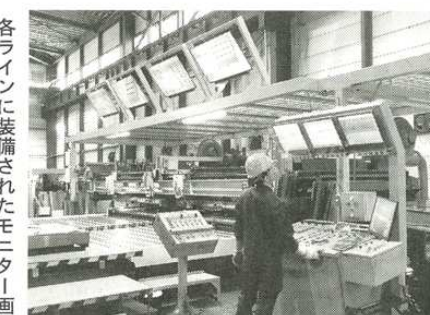
各ラインに整備されたモニター画面は自動化・ペーパーレス化を促進する「根津らしさ」の象徴